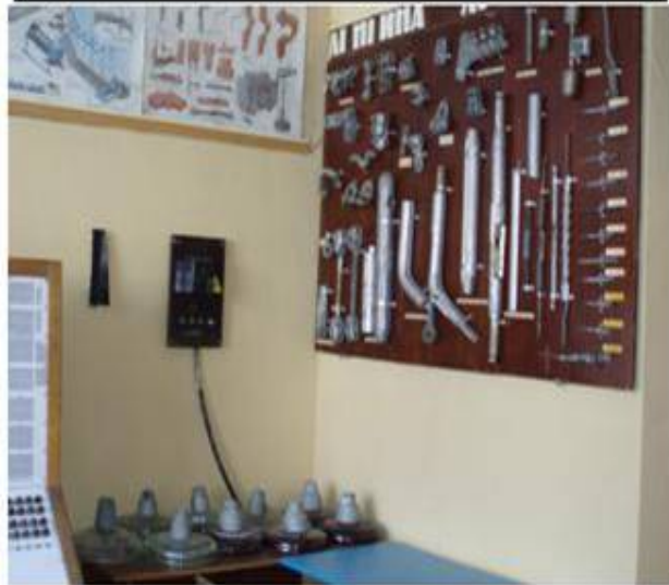
Лабораторія електричних систем та мереж