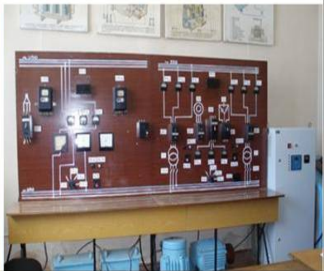
Лабораторія типового електроприводу підприємств нафтогазової промисловості