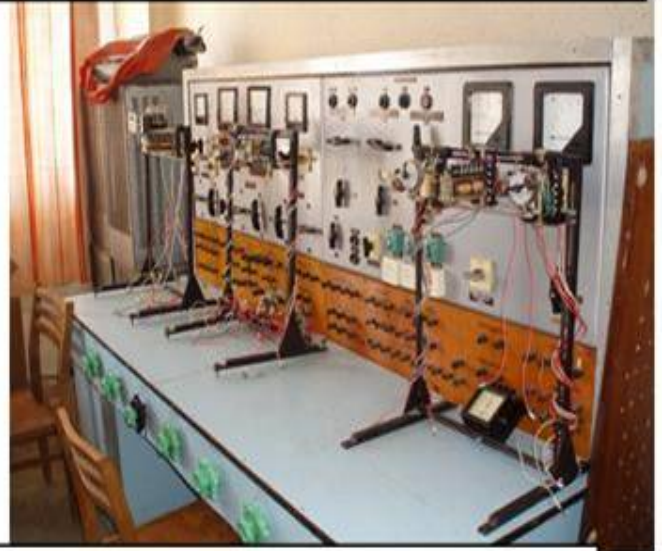
Лабораторія релейного захисту та автоматизації