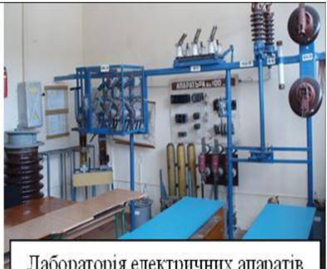
Лабораторія електричних апаратів