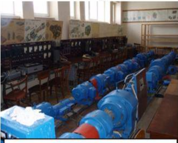
Лабораторія електричних машин

20.08.2004 10:11 - Обновлено 14.02.2014 09:19