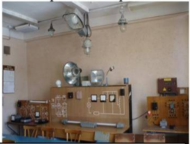
Лабораторія електросилових та електроосвітлювальних установок