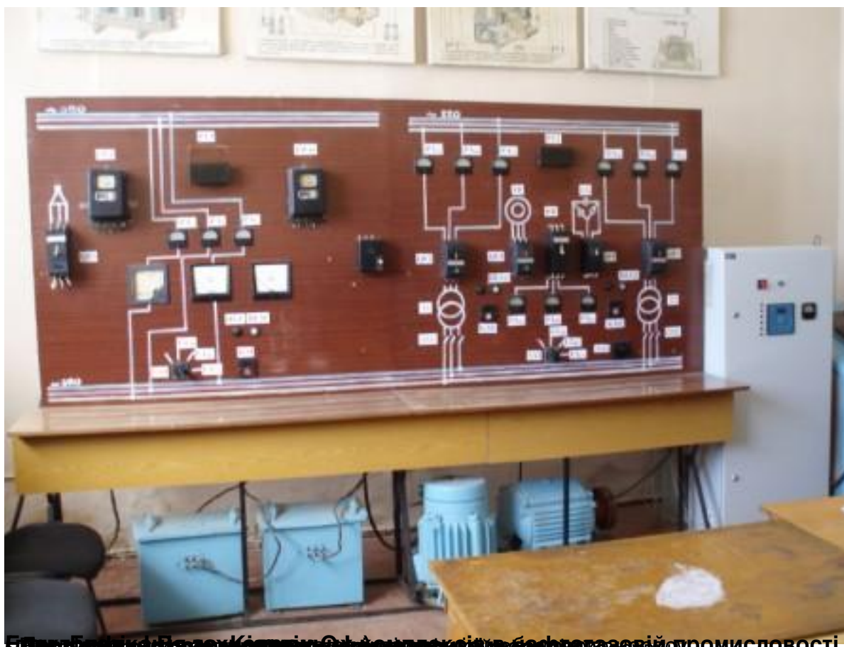
Блок Блоків Релев Кіргіза Гідротехнічного Нафтогазової промисловості

27.02.2012 16:59 - Обновлено 27.02.2012 17:18